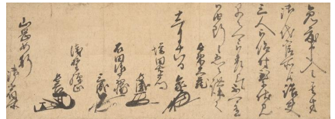
豊臣家奉行人連署書状 (山岡如軒宛)