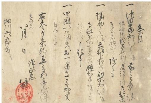
織田信長朱印状(細川昭元宛)